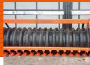
ROULEAU EN CAOUTCHOUC D= 500 MM

Recommandé pour les sols moyens et lourds. Il émiette des grumeaux, compacte le sol et crée des rainures pour une meilleure pénétration d'eau.