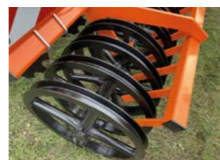
ROULEAU C-RING D= 600 MM

Recommandé pour les sols moyens et lourds. Il émiette des grumeaux, compacte le sol et crée des rainures pour une meilleure pénétration d'eau. De plus des raclettes facilitent une rotation du rouleau et offrent un déchetage additionnel.