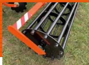
ROULEAU BARRE D= 540 MM OU D= 620 MM

Le rouleau est recommandé pour les sols légers à moyens.