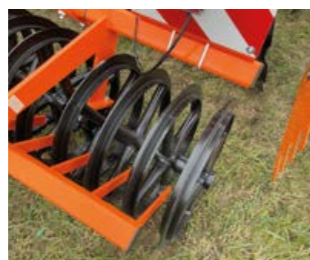
ROULEAU T-RING D= 600 MM

Le rouleau est recommandé pour le labourage réduit du sol, pour le semis dans paillis, il a un bon effet de reconsolidations et un bon tassement du sol. La grande surface de contact garantit que le rouleau ne s'enfoncé pas.