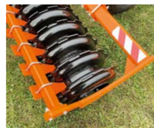
ROULEAU SILLONNEUR D= 600 MM

L'application du rouleau est identique à celle du rouleau tandem standard à anneaux en U, mais la conception basée sur des jantes soudées à un tube commun surdimensionné fait que le rouleau se caractérise par une plus grande robustesse nécessaire pour des conditions de sol plus difficiles.