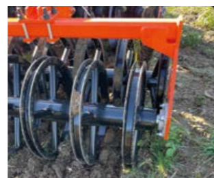
ROULEAU DOUBLE C-RING TANDEM HD D= 600 MM

Le rouleau à anneaux est recommandé pour les sols lourds et motteux, il émiette des grumeaux, il compacte le sol et crée des rainures qui améliorent l'absorption d'eau. Il est résistant aux impacts de pierres.