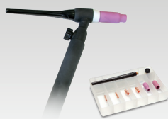
Torche TIG 17 à valve - 4 m 087583