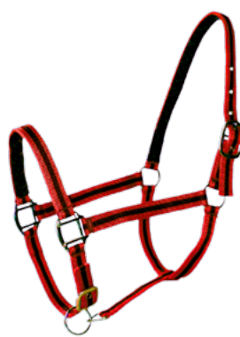
Rouge / Noir