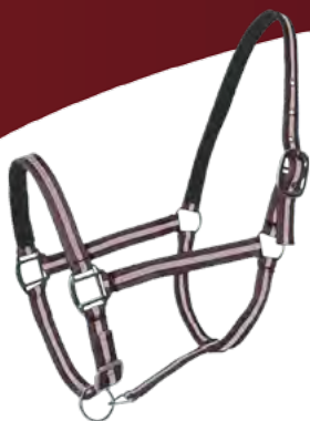
Choco / Beige