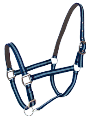
Navy / Ciel

Reconnu pour son rapport qualité/prix , le LICOL DOUBLÉ CUIR est certainement le plus répandu dans le monde équestre. Alliant confort et solidité , il est également facile d'entretien .