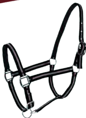
Noir / Gris