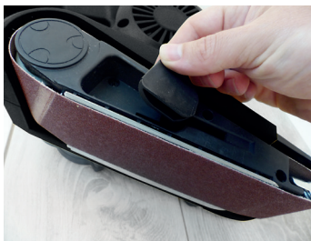
Changement rapide Fast changing

Livrée avec 1 bande abrasive grain 80 et un sac à poussières Delivered with abrasive belt grit 80 and a dust bag