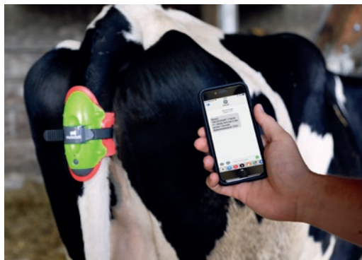
Vos SMS et e-mails sur deux smartphones de votre choix