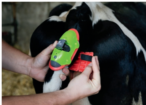
Installation facile grâce au système de fermeture