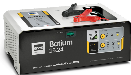
Interface simple d'utilisation