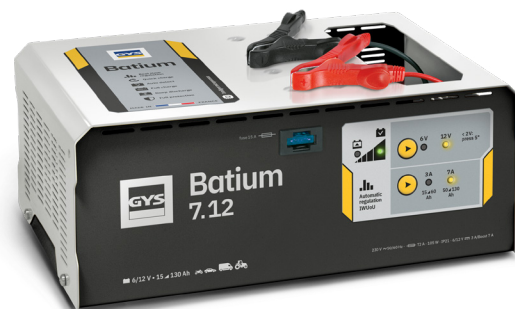
Interface simple d'utilisation