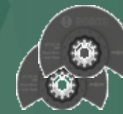
ACZ 85 EB & EC