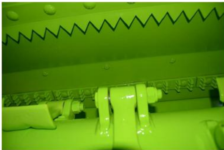
Rotor hélicôïdale avec contre-marteaux très agressifs